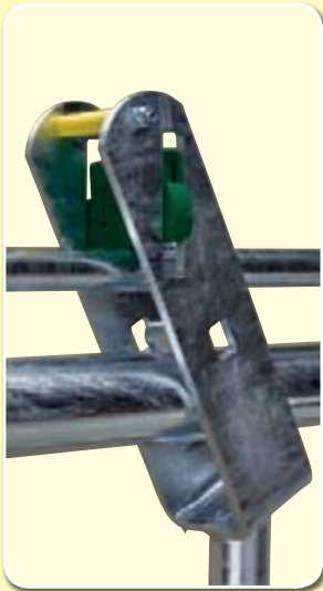
Massiver, kunststoffbeschichteter Riegelbolzen