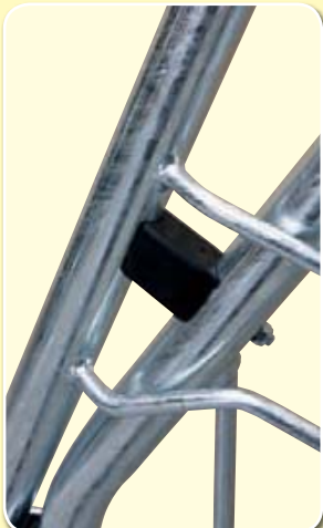
Massiver Gummipuffer für maximale Lärmdämmung