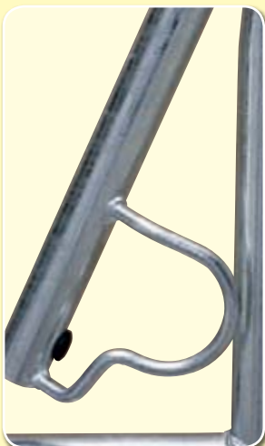
Lärmdämmung und Abweisbügel unten