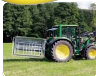
Transport über Schlepper-Dreipunkt-Anhängung mit beigeklapptem Kälberschlupf

Schiebedach kann durch die Tiere nicht geöffnet werden