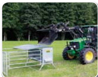
Einfache Beschickung per Frontlader