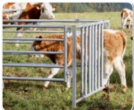
Das Kalb betritt über den in der Breite verstellbaren Zugang den Selektionsbereich vor dem Krafftutterautomat