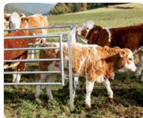
Das Kalb verlässt den Futterautomat ohne dass es bei der Krafftutteraufnahme von der Herde gestört wurde