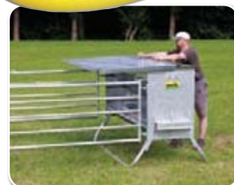
Ein großes Schiebedach mit 2 Handgriffen für leichtes Befüllen

Schiebedach kann durch die Tiere nicht geöffnet werden