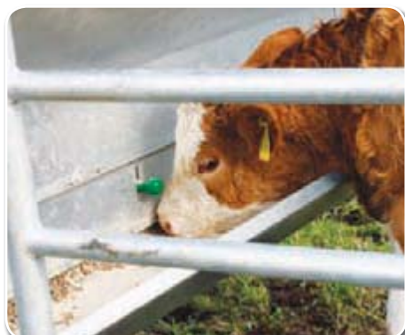
Das Kalb kann Krafftutter aus dem Trog nach belieben fressen; die Zulauföffnung kann verstellt bzw. ganz verschlossen werden.