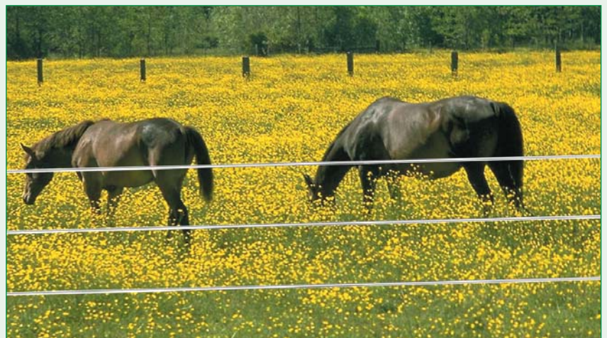
PATURA TornadoXL Seile für optimale Sichtbarkeit und Sicherheit

Edelstahlleiter sind extrem haltbar, Kupferleiter sehr gut leitfähig. Durch eine Kombination beider Materialien wird ein gebrochener Kupferleiter durch einen Edelstahlleiter überbrückt. Die volle Schlagstärke bleibt bis zum Zaunende erhalten.