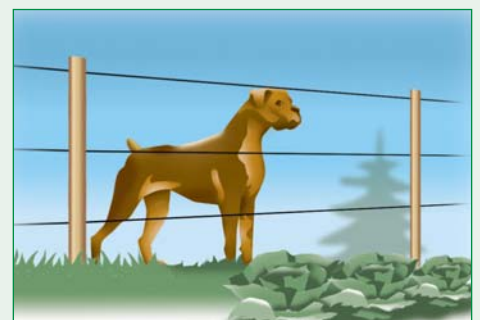
Elektrozäune für große Hunde sind 0,85 m bis 1,05 m hoch mit 2 bis 4 Drähten.