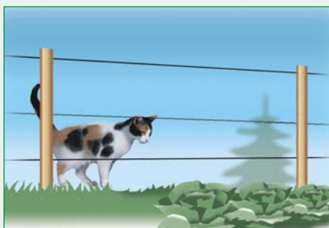
Elektrozäune für Katzen sind 0,55 m bis 0,75 m hoch mit 3 bis 4 Drähten.

Hunde sind sehr leicht mit dem Elektrozaun zu begrenzen. Sie reagieren sofort auf die leichten Stromschläge und prägen sich diese sehr genau ein, sodass sie sich nach kurzer Zeit dem Zaun nur noch mit deutlichem Abstand nähern. Hunde versuchen gerne bei zu hoch angebrachten unterem Draht unter diesem hindurch zu schlüpfen. Durch die sehr stark variierenden Größen bei Hunden sind Anzahl und Abstände der einzelnen Drähte sehr unterschiedlich. Bitte achten Sie darauf, dass Ihr Hund den Elektrozaun erst kennenlernen muss und nach kurzer Eingewöhnungszeit von max. 1 – 2 Tagen den Umgang mit dem Zaun erlernt hat.