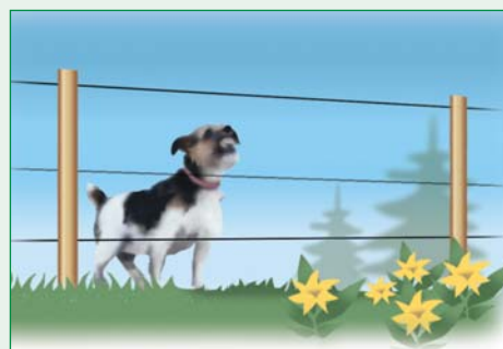
Elektrozäune für kleine Hunde sind 0,55 m bis 0,75 m hoch mit 3 bis 4 Drähten.